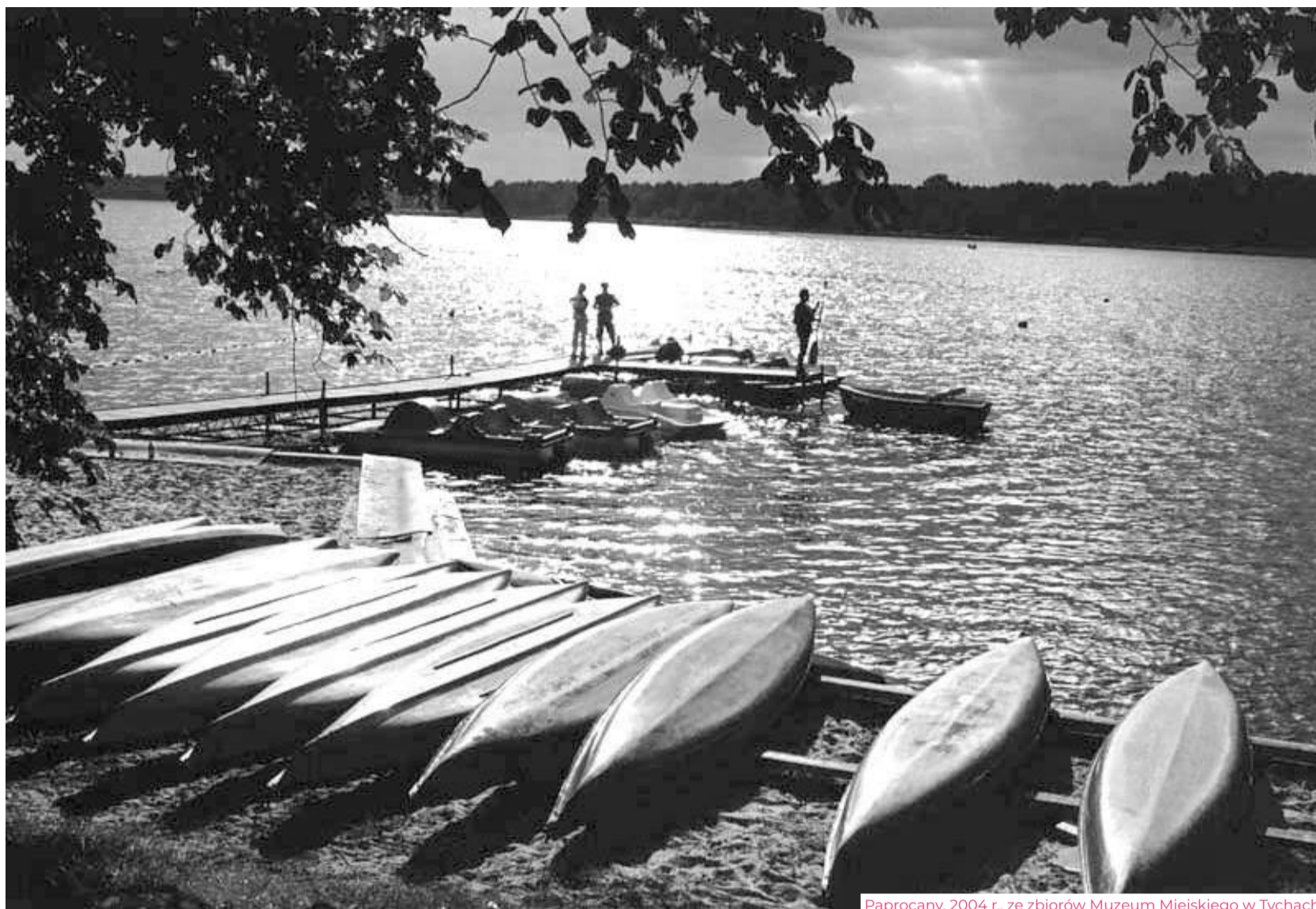
Paprocany, 2004 r.