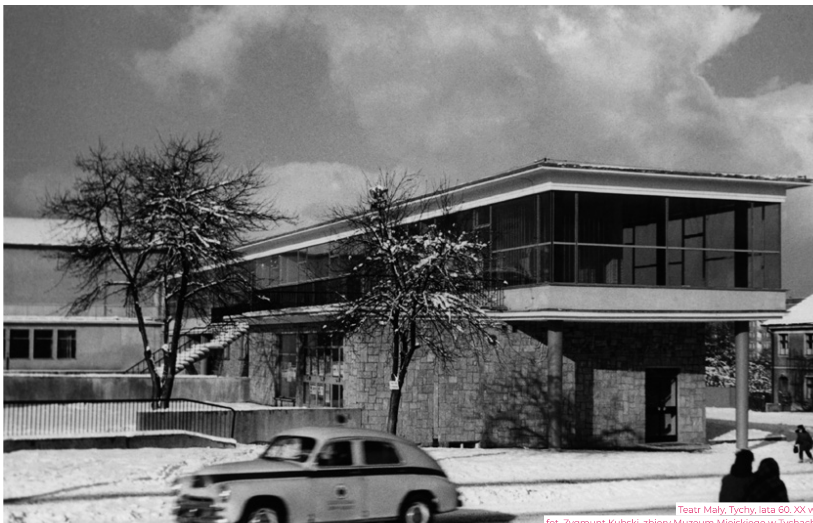
Teatr Mały, Tychy, lata 60. XX w.