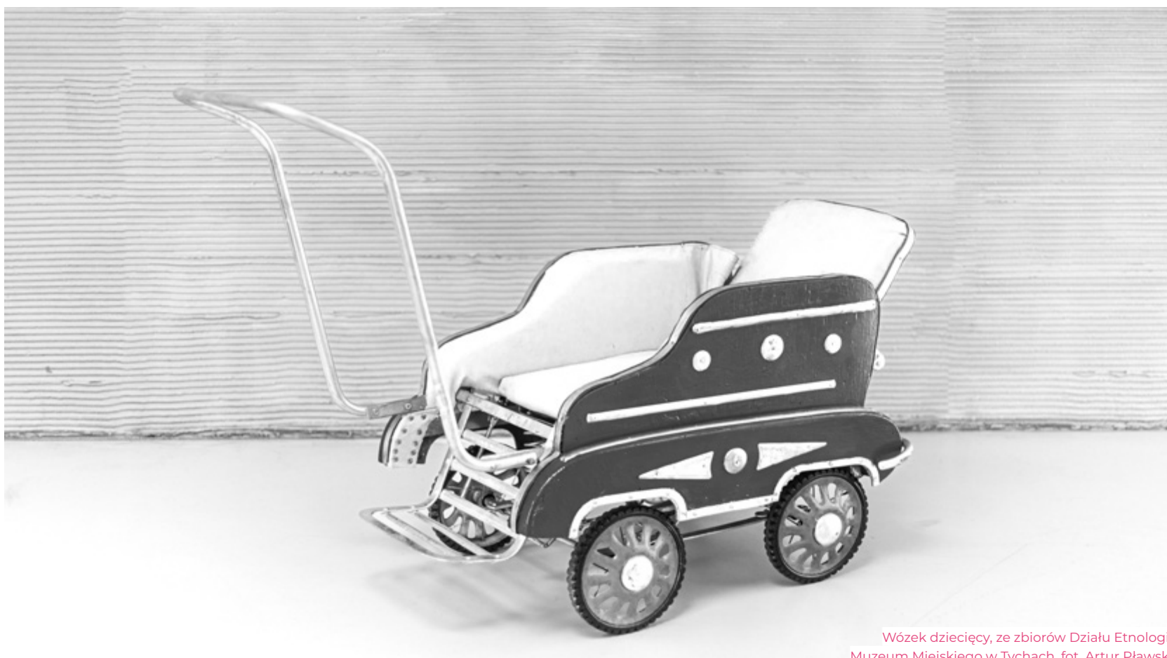
Wózek dziecięcy, ze zbiorów Działu Etnologii Muzeum Miejskiego w Tychach