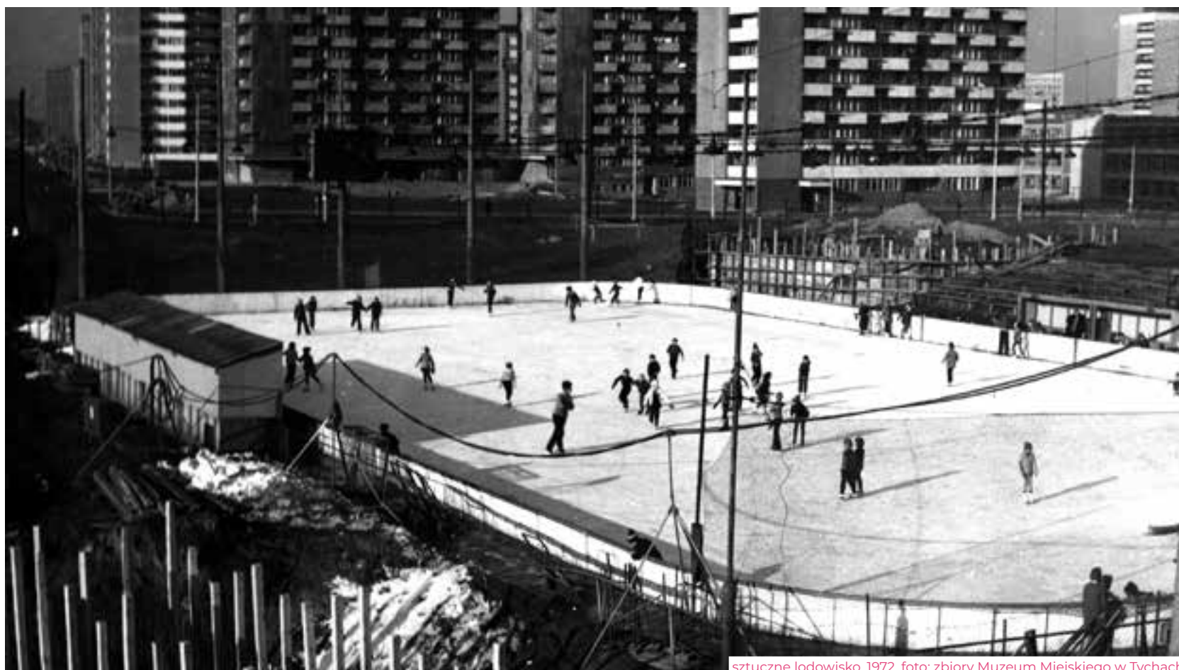
szkuczne lodowisko, 1972, foto: zbiory Muzeum Miejskiego w Tychach