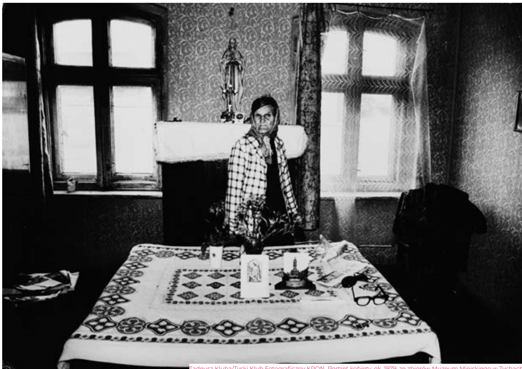
Tadeusz Kluba/Tyski Klub Fotograficzny KRON, Portret kobiety , ok. 1979, ze zbiorów Muzeum Miejskiego w Tychach