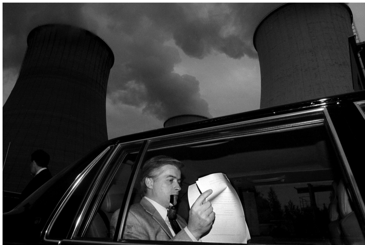
„I znów ten cholerny, zadymiony Śląsk...”, 1996 r.